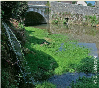
La Dhuis à Pargny